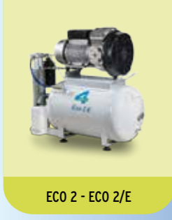
ECO 2 - ECO 2/E

Se richiesto anche a 60Hz / If requested even at 60Hz - A richiesta anche trifase / If requested even tri-phase