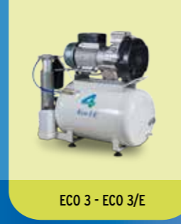
ECO 3 - ECO 3/E