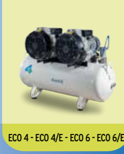
ECO 4 - ECO 4/E - ECO 6 - ECO 6/E