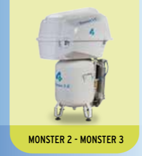
MONSTER 2 - MONSTER 3