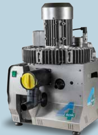
RAIN 2+ - RAIN3+ - RAIN 4+